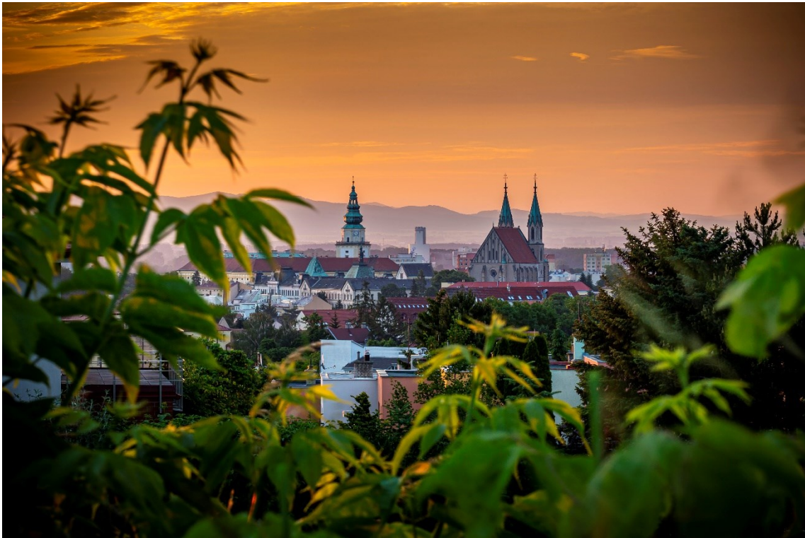
Pohled na Kroměříž