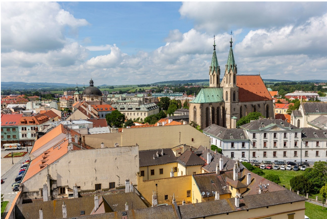
Kostel sv. Mořice