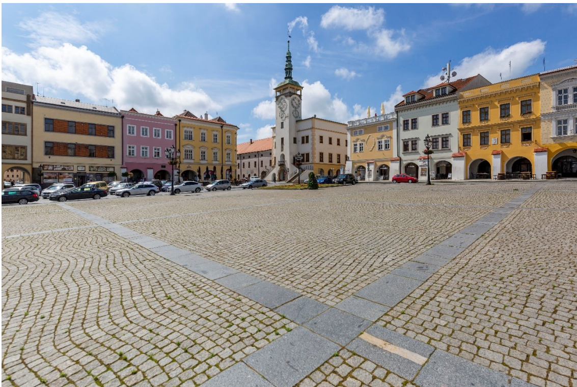
Velké náměstí s radnicí