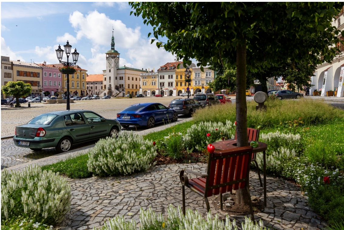
Velké náměstí s radnicí